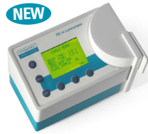
고감도의 Portable FB14 Stand-alone operation