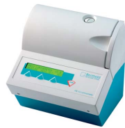
고감도의 합리적인 가격 FB12 Stand-alone operation