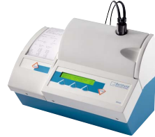
고감도의 최고 사양 SIRUS Stand-alone operation